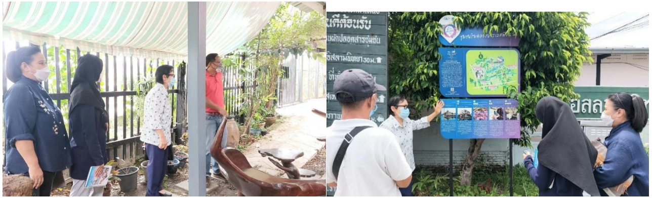
10) ประชุมการจัดการสิ่งแวดล้อม การจัดการขยะที่แพลตคลองจั่น 22-30 วันที่ 13 กรกฎาคม 2565 ที่แพลตคลองจั่น 25 เขตบางกะปิ