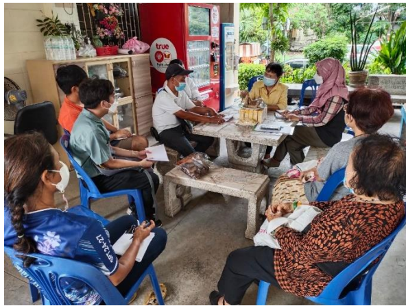
8) ประชุมการจัดการท่องเที่ยวและสิ่งแวดล้อมย่านคลอง 14 วันที่ 6 กรกฎาคม 2565 ที่ อบต.บึงน้ำรักษ์