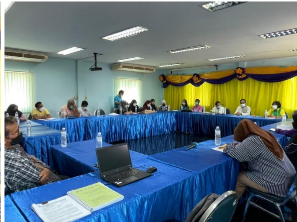
9) ประชุมการจัดการท่องเที่ยวย่านคลองประเวศบุรีรมย์ วันที่ 7 กรกฎาคม 2565 ที่ชุมชนประเวศฝั่งเหนือ เขตประเวศ