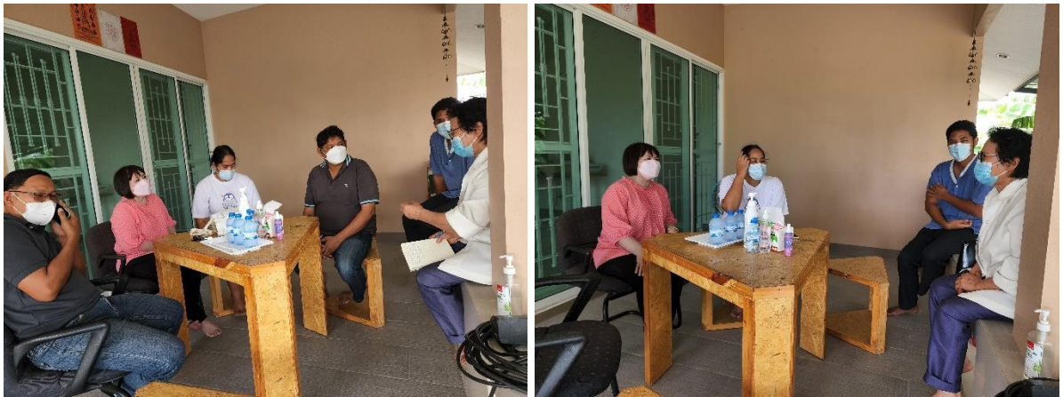
7) ประชุมหารือการจัดการสิ่งแวดล้อม การจัดการขยะพลตคลองจั่น 25 วันที่ 3 กรกฎาคม 2565 ที่พลตคลองจั่น 25 เขตบางกะปิ