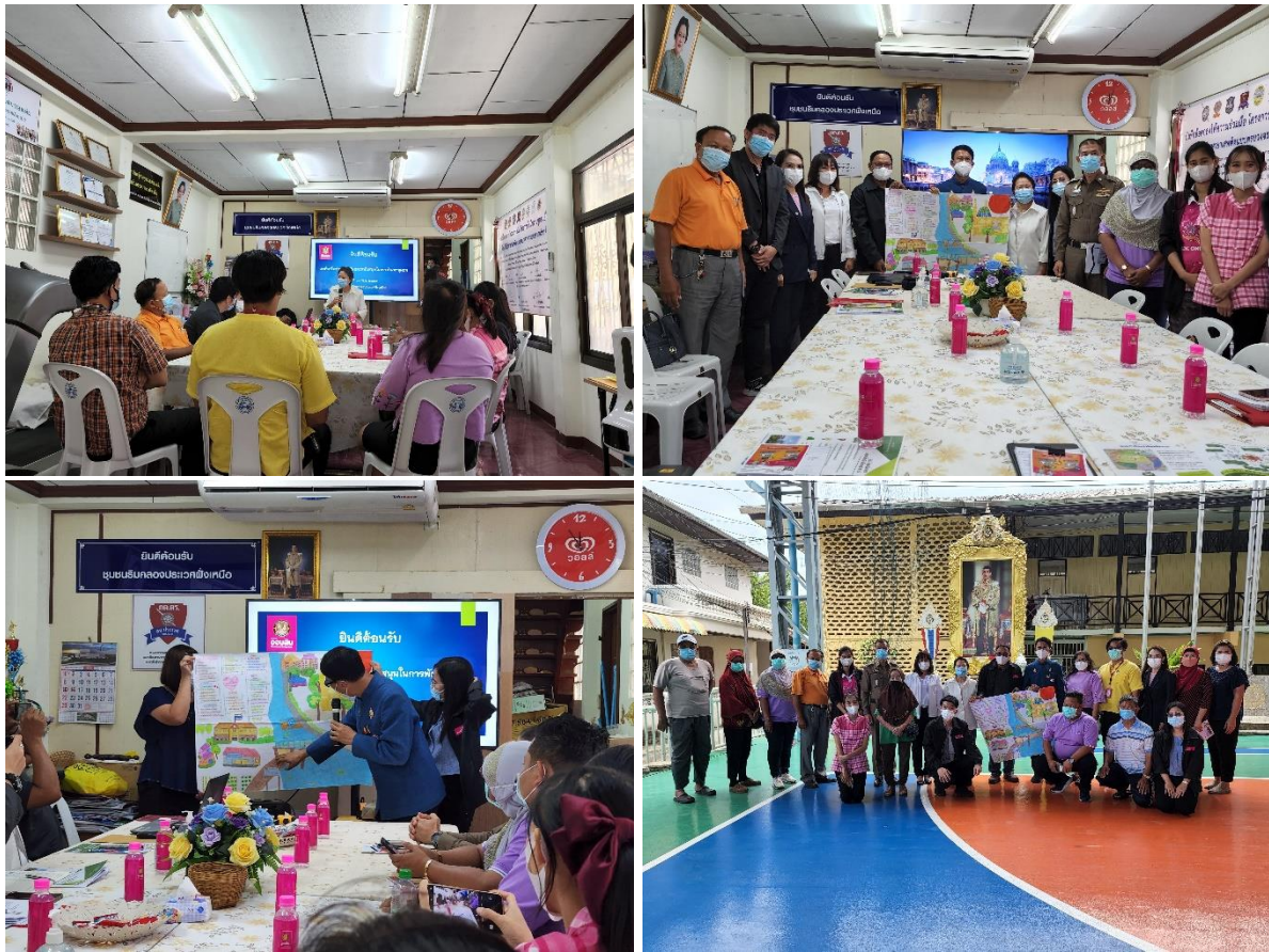
6) ประชุมหารือกิจกรรมการจัดกิจกรรมสิ่งแวดล้อม ชุมชนดอกไม้ เขตประเวศ วันที่ 10 พฤษภาคม 2565